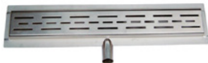
DESAGÜE RECTANGULAR REJILLA DUCHA 50, 90, 120 cm