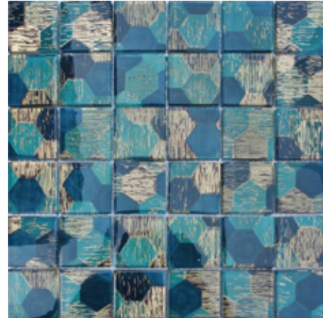
Azul - 30*30 cm