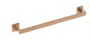
ACABADO · Rose gold.