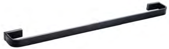
02. | Acabado Negro