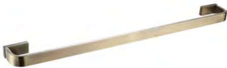
03. | Acabado Bronce