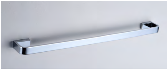
01. | Acabado Cromado