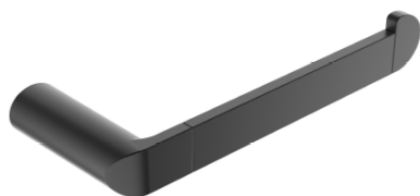
ACABADO · Negro mate.