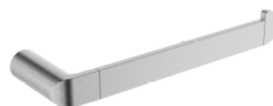
ACABADO · Niquel.