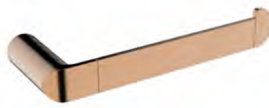
ACABADO · Rose gold.