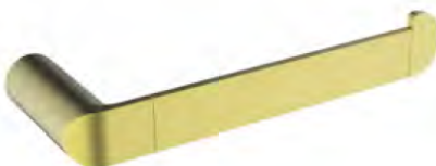
ACABADO · Gold.