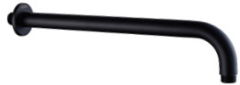
ACABADO Negro mate