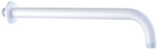
ACABADO Blanco brillante.