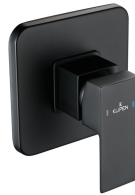
ACABADO · Negro.