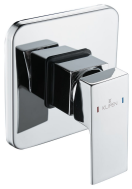
ACABADO · Cromado.