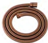
ACABADO · Rose gold.