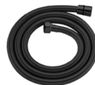
ACABADO · Negro mate.