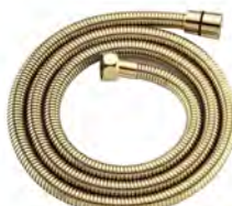
ACABADO · Gold.