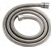
ACABADO · Niquel.