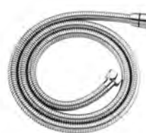
ACABADO · Cromado.