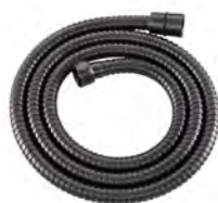
ACABADO · Gun grey.