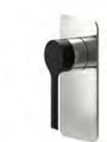
ACABADO · Nickel