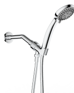
ACABADO · Cromado.