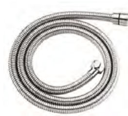
ACABADO · Cromado