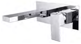
ACABADO · Cromado