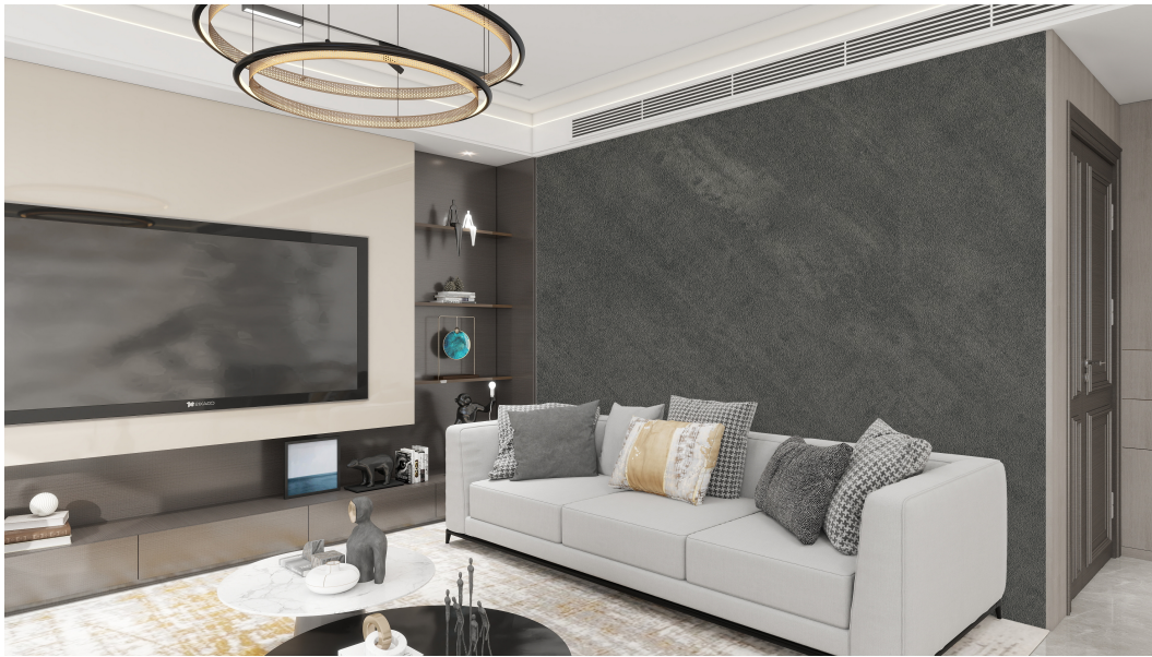
*Imagen referencia ambiente

Los paneles de pared impermeables STEIN representan la última generación en revestimientos murales SPC (Stone Plastic Composite), diseñados tanto para uso doméstico como comercial en interiores. Su núcleo está compuesto por más del 70% de polvo de piedra y cuenta con un acabado decorativo protegido por una capa de filtro UV y una película de protección polietileno (PE). Gracias a las avanzadas tecnologías empleadas, el producto ofrece parámetros de rendimiento y calidad excepcionales.