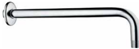
ACABADO · Cromado.