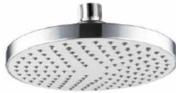
ACABADO · Cromado.